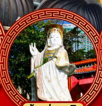
เจ้าแม่กวนอิม รพัสสัย