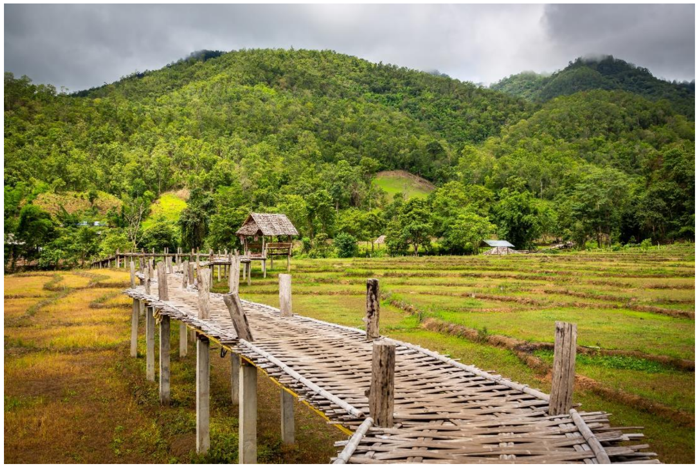
นำท่านเดินทางสู่ บ้านรักไทย

นำท่านเดินทางไป สะพานชุตองเป้ สะพานไม้ไผ่ที่สร้างขึ้นโดย พระภิกษุ สามเณร และชาวบ้านทุ่งไม้สัก โดย สะพานแห่งนี้จะเชื่อมระหว่าง สวนธรรมภูสมะ กับ หมู่บ้านทุ่งไม้สัก เพื่อให้พระภิกษุสามเณร เดินบิณฑบาต และให้ชาวบ้านได้เดินข้ามสัญจรไปมาอีกด้วย